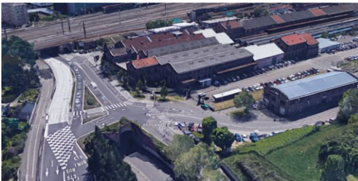
Vue aérienne reconstituée par Google Earth de l'entrepôt où va s'installer La Grenze.

scène, des bars, une cuisine et voilà ! »